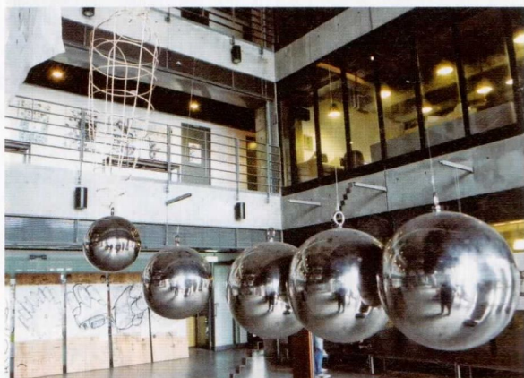
校園內每個角落都有學生的創作作品。

民生學院、設計學院、管理學院、商學與資訊學院及文化與創意學院，共5學院，34系所（下設有31個學士班，2個學士學位學程，1個碩士學位學程，13個碩士班，4個碩士在職專班和1個博士班）