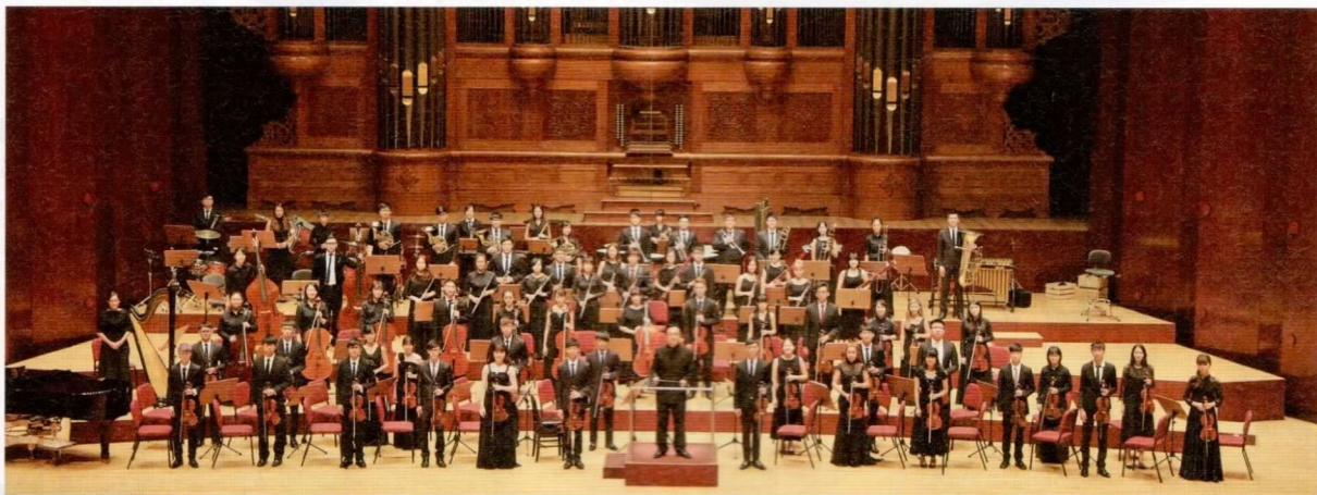
音樂系交響樂團與管樂團每年於校內及國家音樂廳舉辦音樂會。