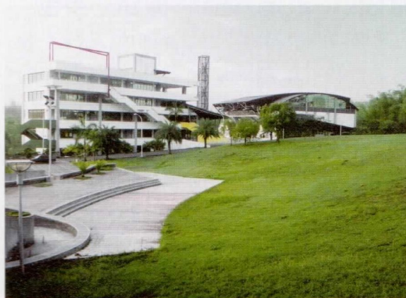
實踐大學高雄校區。